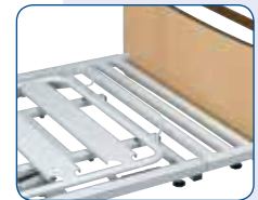
Extensión de somier de 20 cm.