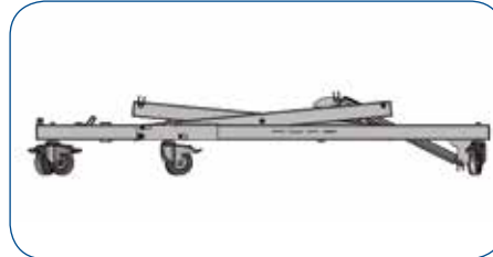
Levantar ligeramente la cruceta para montar la base.