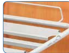
Anchas láminas metálicas soldadas. Diseñadas para un fácil mantenimiento.