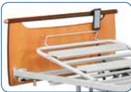
Elevador de respaldo eléctrico (estándar)