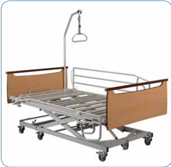
3 funciones eléctricas con plegado de rodillas.

Ideal para el domicilio. La cama XXL X'PRESS se desplaza en posición vertical. Montaje sin herramientas