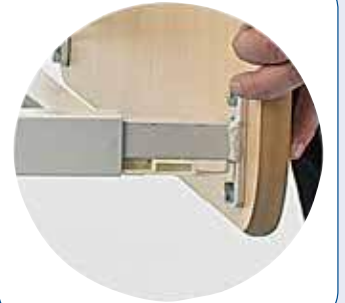
Fijación de los paneles por sistema EASY MOVE: sencillo, rápido y seguro.