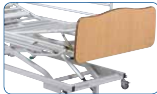
Elevador de piernas manual, con cremalleras.