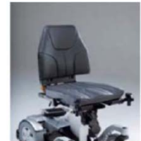
Unidad de asiento Onyx