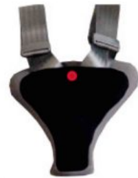
Protector de seguridad Hernik