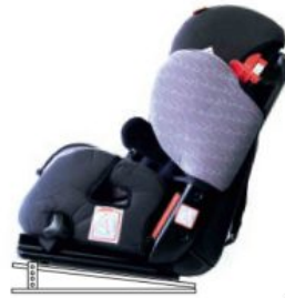
Base ajustable en inclinación Starlight-Nxt