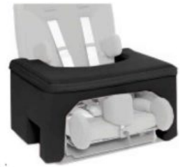
Mesa de seguridad Starlight-Nxt