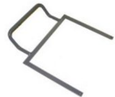
Arco de estabilización Starlight-Nxt