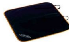
Protector asiento de coche Hernik