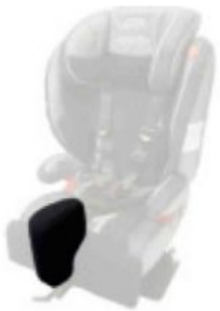
Taco abductor extraíble Starlight-Nxt