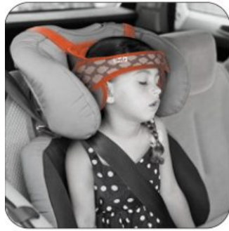
Fijación para la cabeza Hernik