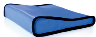
Cojín en cuña