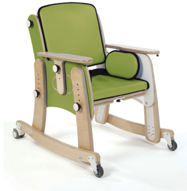
Base con Ruedas