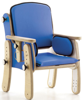
Base con patas