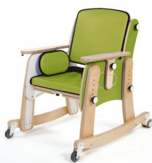
Base con Ruedas