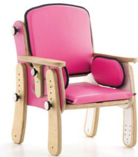
Base con patas