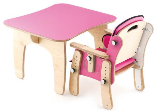
Mesa PAL 2 personas