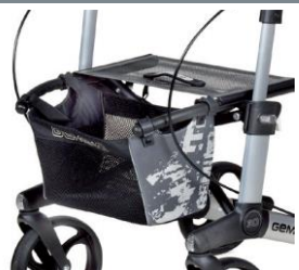
// 7104035 Bolsa estampada gris/negro