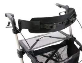
// 7109035 (3) Respaldo ajustable comfort