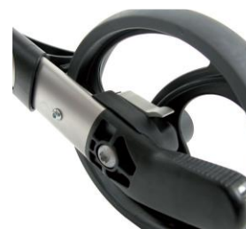
// 7109080 Freno de desaceleración