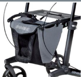
// 7104025 (1) Gris/negra