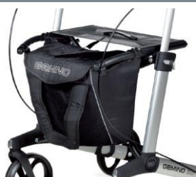
// 7104006 (1) & 7104007 Bolsa Advance con tapa y asas negra