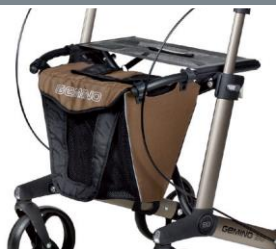
// 7104024 (1) Marrón/negra