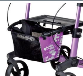
// 7104033 Bolsa estampada violeta/negro