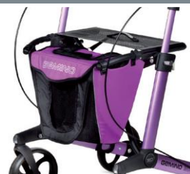
// 7104023 (1) Violeta/negra