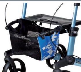
// 7104032 Bolsa estampada azul/negro