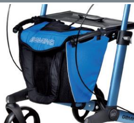
// 7104022 (1) Azul/negra