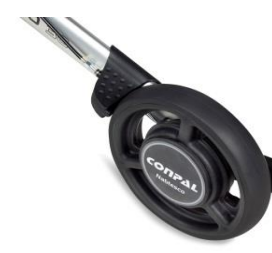
// 9009329 (2) Ruedas SpeedControl

(1) No disponible para Geminos 60 M/60 M Walker. (2) No disponible para Geminos 60 / 60 M y Gemino 60 Walker/60 M Walker.