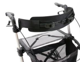
// 7109035 (3) Respaldo ajustable comfort