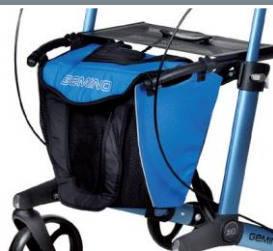
// 7104022 (1) Azul/negra