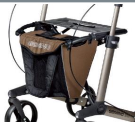
// 7104024 (1) Marrón/negra