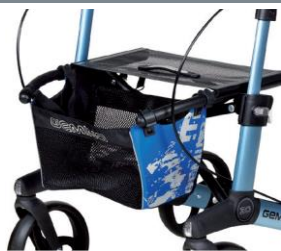
// 7104032 Bolsa estampada azul/negro