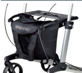
// 7104006 (1) & 7104007 Bolsa Advance con tapa y asas negra