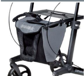
// 7104025 (1) Gris/negra