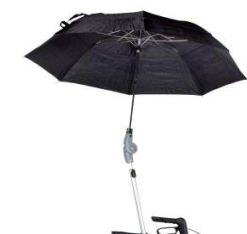
// 7109060 Paraguas, color negro