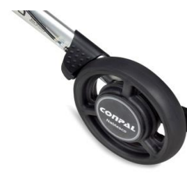
// 9009329 (2) Ruedas SpeedControl

(1) No disponible para Geminos 60 M/60 M Walker. (2) No disponible para Geminos 60 / 60 M y Gemino 60 Walker/60 M Walker.