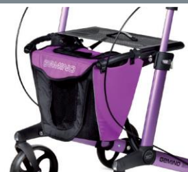
// 7104023 (1) Violeta/negra