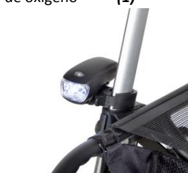
// 7109095 Luz