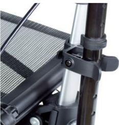
// 7109011 Soporte de bastones