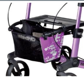
// 7104033 Bolsa estampada violeta/negro