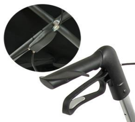
// 7109071 (2) Freno de una sola mano