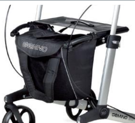
// 7104006 (1) & 7104007 Bolsa Advance con tapa y asas negra