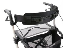
// 7109035 (3) Respaldo ajustable comfort