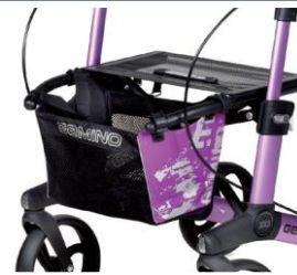
// 7104033 Bolsa estampada violeta/negro