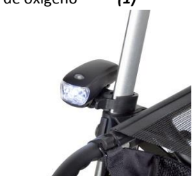
// 7109095 Luz