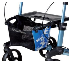
// 7104032 Bolsa estampada azul/negro