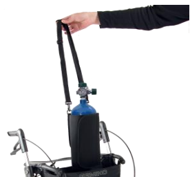
// 7109050 & 7109051 Soporte para bombonas de oxígeno (1)