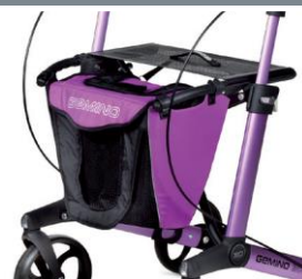
// 7104023 (1) Violeta/negra