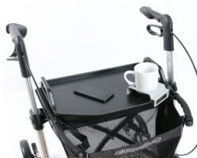
// 7109140 Mesa -bandeja