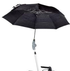
// 7109060 Paraguas, color negro