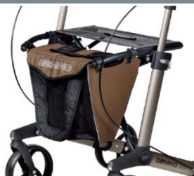
// 7104024 (1) Marrón/negra