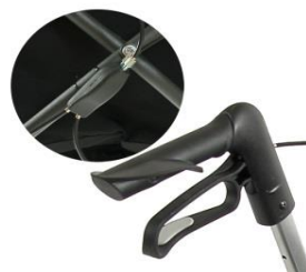
// 7109071 (2) Freno de una sola mano