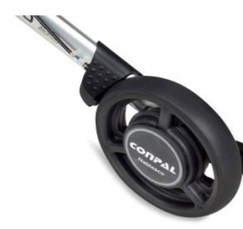
// 9009329 (2) Ruedas SpeedControl

(1) No disponible para Geminos 60 M/60 M Walker. (2) No disponible para Geminos 60 / 60 M y Gemino 60 Walker/60 M Walker.