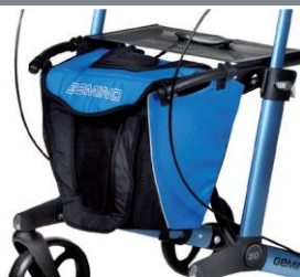
// 7104022 (1) Azul/negra