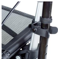
// 7109011 Soporte de bastones