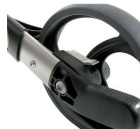
// 7109080 Freno de desaceleración