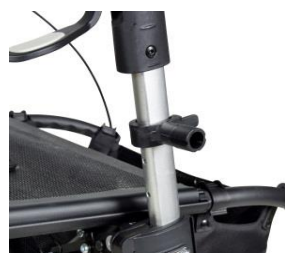
// 7109090 Abrazadera universal