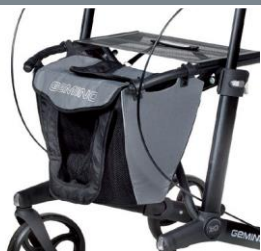
// 7104025 (1) Gris/negra