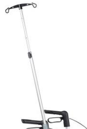
// 7109100 Soporte de gotero