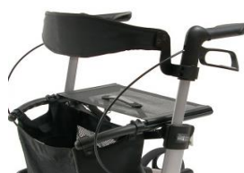
// 7109020 & 7109021 Respaldo (2) (3)