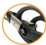
Slow down brake