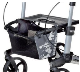
// 7104035 Bolsa estampada gris/negro