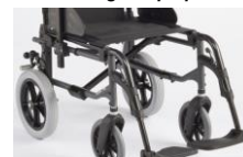
Action2Ng Kit transit