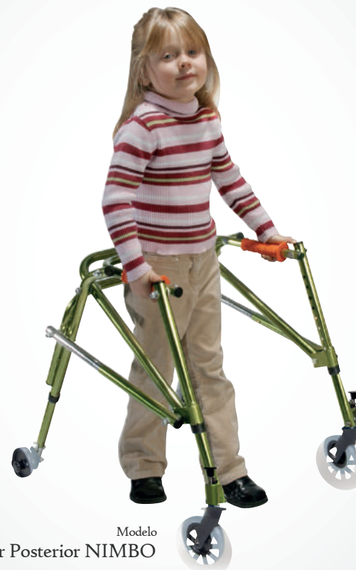
Modelo Andador Posterior NIMBO