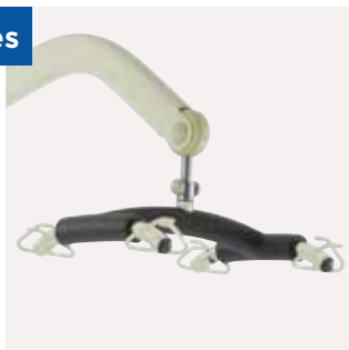
Percha de 4 puntos para mayor comodidad.