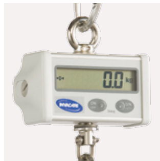
Báscula Se coloca con un kit de adaptación entre el brazo y la percha.