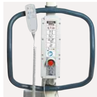
Jumbo Care Este sistema de monitorización inteligente incluye un indicador de servicio, operación de emergencia, alarma audible de la batería y un indicador de carga de la batería.