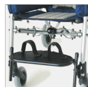
▶ 827 Correas sujetapiés