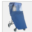
▶ 825 Funda de lluvia (montar únicamente luego de haber colocado la capota 819)