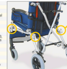
▶ 831 (solo Medidas 1-2-3) serie de 4 puntos de sujeción (anillos) por el transporte en dirección del sentido de marcha, en vehículos en movimiento (coches privados, autobuses, etc.)