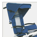
▶ 819 Capota