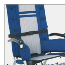
▶ 828 correa abdominal