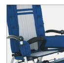
▶ 894 Correa pélvica de 45°