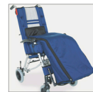
▶ 818 Cubierta térmica