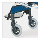
▶ 812 Orientadores de ruedas delanteras