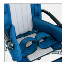
▶ 817 Correas inguinales