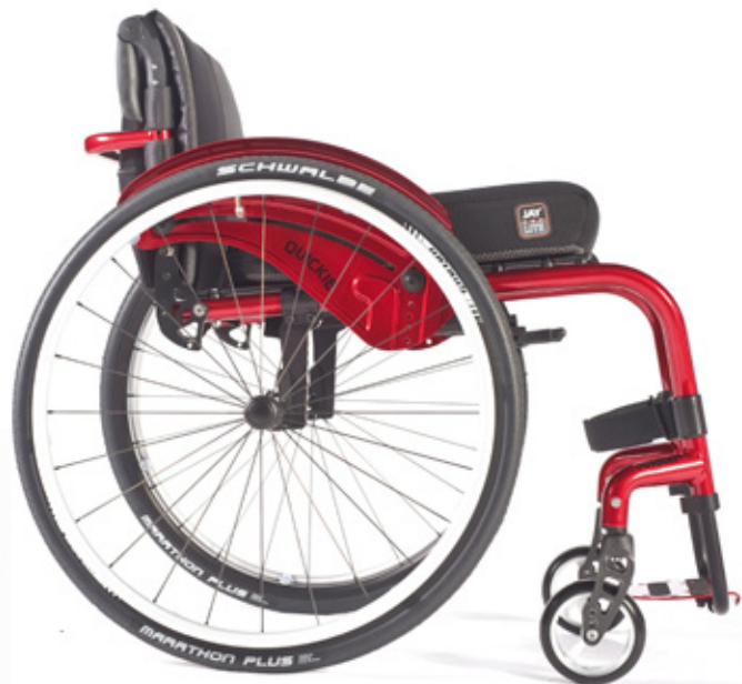
Argon 2 - Robusta y resistente. Lo último en adaptabilidad

Argon 2 ha conseguido aunar en una sola silla las ventajas de un chasis rígido y de una silla ajustable. La rigidez que le confiere su estructura fija, junto con las posibilidades de regulación de la silla, convierten a la Argon 2 en la compañera ideal para tu vida activa. Todo ello en un diseño de armazón abierto y con una estética más moderna y deportiva que nunca.