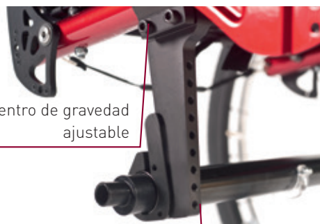
Ajustes de la altura de asiento trasera y del ángulo de asiento