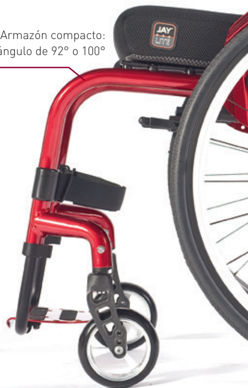
Armazón compacto: ángulo de 92° o 100°

> Diseño innovador del armazón frontal . Moderno y con una gran resistencia.