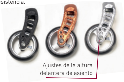
Ajustes de la altura delantera de asiento

La búsqueda de nuevos materiales y tecnologías ha sido clave en el desarrollo de la Argon 2 . El material utilizado en las horquillas es Carbotecture - un material de fibra de carbono extremadamente fuerte y ligero, con una gran resistencia a los impactos. El diseño curvado del tubo de la horquilla se ha conseguido mediante la técnica del Hydroforming , que permite obtener geometrías complejas del tubo con la mayor resistencia.