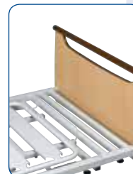
Extensión de somier de 20 cm.