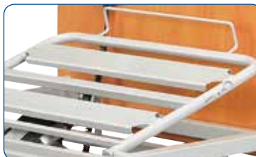
Anchas láminas metálicas soldadas. Diseñadas para un fácil mantenimiento.