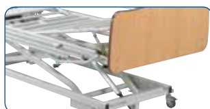
Elevador de piernas a cremallera.

EL ELEVADOR DE PIERNAS: se pueden elegir diferentes versiones de elevadores de piernas.