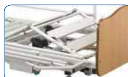
Elevador de piernas con plegado de rodillas.