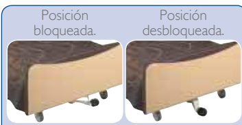
Posición bloqueada. Posición desbloqueada.

Freno independiente en cada rueda de la cama.