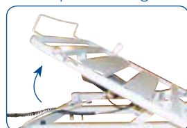
Elevador de respaldo con traslación. Permite evitar el deslizamiento hacia delante.