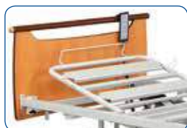
Elevador de respaldo eléctrico (estándar)

EL ELEVADOR DE RESPALDO: se pueden elegir diferentes versiones de elevadores de respaldo.