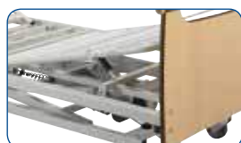
Elevador de piernas eléctrico.