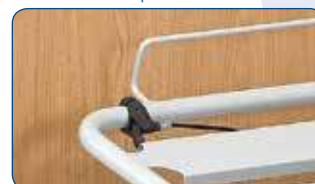
Elevador de respaldo con bajada de emergencia. Accesible en el cabezal y en los dos lados de la cama.

EL ELEVADOR DE PIERNAS: se pueden elegir diferentes versiones de elevadores de piernas.