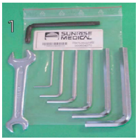
XFF090000 Kit de herramientas