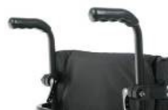
XFF 030204 Empuñaduras ajustables en altura