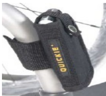
XFF090026 Soporte para móvil