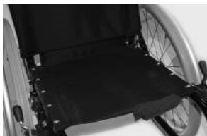
XFF 020002 Tapicería de asiento con 1 bolsillo