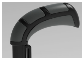
XFF 030201 Empuñaduras standard largas