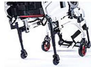
XFF090010 Ruedas de tránsito