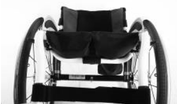
XFF 020003 Tapicería de asiento con 2 bolsillos