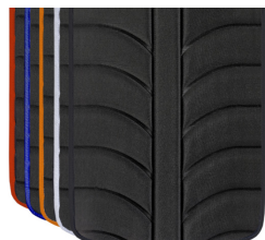
Colores ribetes tapicerías EXO EVO