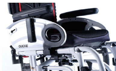
XFF04000x Reposabrazos de escritorio