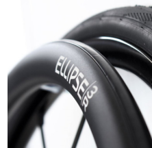
XFF070212 Ellipse 3R