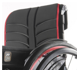
XFF 030316 Tapicería de respaldo EXO EVO