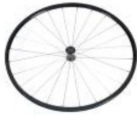
XFF070003 Ruedas traseras ligeras