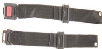
XFF 090018 Cinturón de posicionamiento con cierre