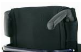
XFF 030203 Empuñaduras plegables