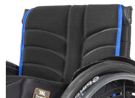
XFF 030317 Tapicería de respaldo EXO EVO PRO