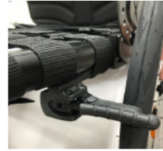
XFF060024 Freno compacto ligero EVO