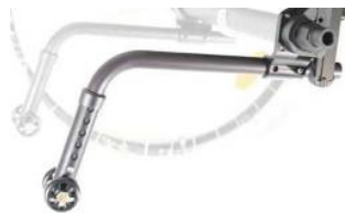
XFF090050 Ruedas antivuelco, no abatibles