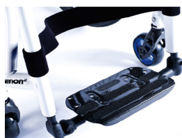
XFF050132 Plataforma única de fibra de carbono