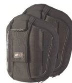
Torácico Medio (MT)