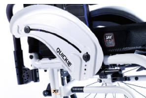
XFF040103 Protector lateral de aluminio (con fender)