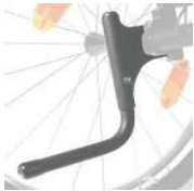
XFF090001 Tubos de cola