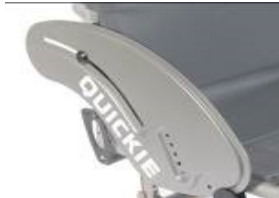
XFF040102 Protector lateral de aluminio (sin fender)