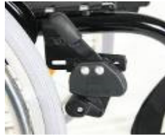
XFF060002 Freno de rodilla (montado alto)