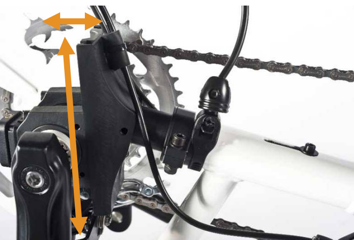
Con manillar ajustable