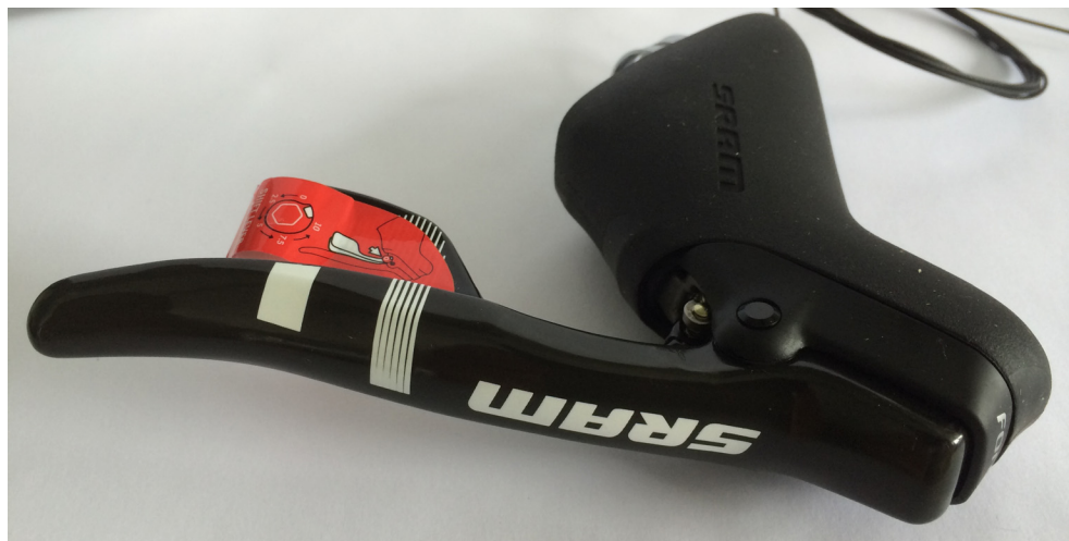
Cambio Control Dual SRAM de standard