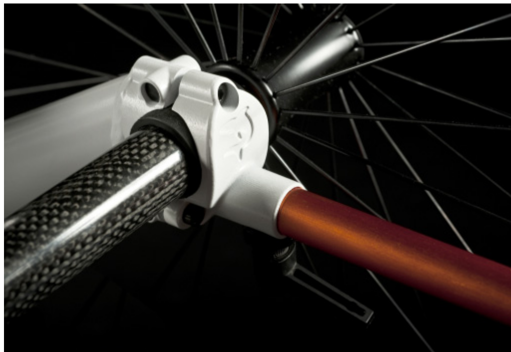
Eje trasero de carbono