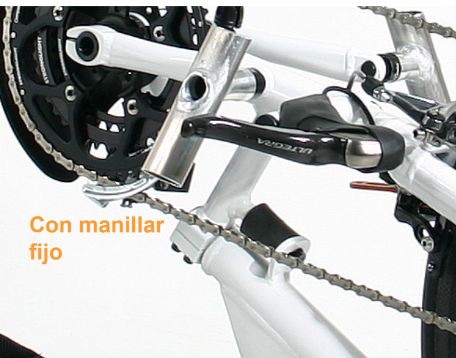
Con manillar fijo