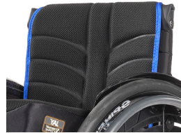
NSW030317 Tapicería de respaldo EXO EVO PRO