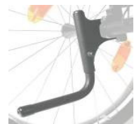
NSW090001 Tubo de cola