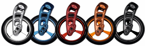
NSW080013 Horquillas Carbotecture en color NSW080306 llantas de aluminio en color