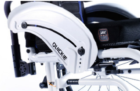
NSW040103 Protector lateral de aluminio (con fender)