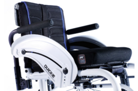
NSE040117 Reposabrazos tubulares acolchados