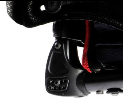
NSW030012 Respaldo ajustable en ángulo, no plegable