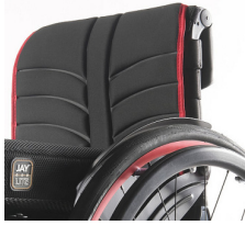
NSW030316 Tapicería de respaldo EXO EVO