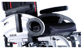
NSW040002 y NSW040004 Reposabrazos de escritorio ajustable en altura