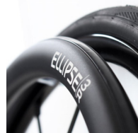
NSW070212 Elipse 3R