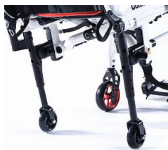
NSW090010 Ruedas de tránsito