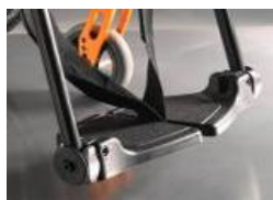
NSW050020 Plataformas individuales de composite