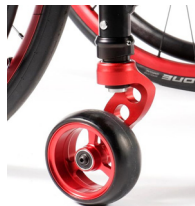
NSW080008 Horquilla de 1 sólo brazo en color