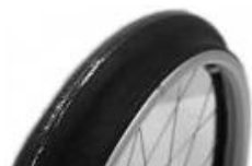
NSW070208 Aros Maxgrepp antideslizantes