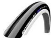
NSW070101 Right Run