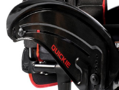
NSW040104 Protector lateral de carbono con fender