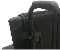
NSW030204 Empuñaduras ajustables en altura