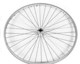
NSW070002 Ruedas de diseño