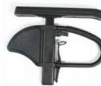
NSW040050 y NSW40051 Reposabrazos ajustables en altura estilo Quickie