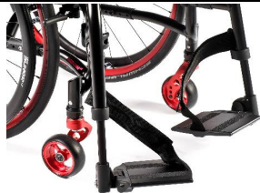
NSW050022 Plataformas individuales de aluminio