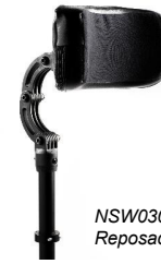
NSW030412 Reposacabezas mediano