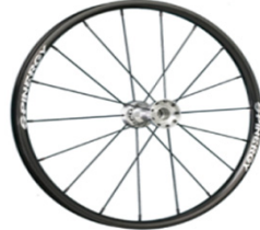
NSW070005 Ruedas Spinergy 18 radios