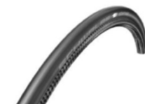
NSW070107 Schwalbe One