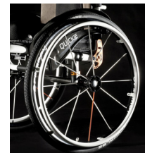
NSW070006 Ruedas Spinergy 12 radios