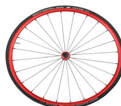
Colores anodizados en carrete y llantas, sólo para ruedas ligeras 24"