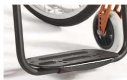
NSW050131 Plataforma única de composite