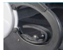
NSW040020 Adaptación tetrapléjia para reposabrazos de escritorio