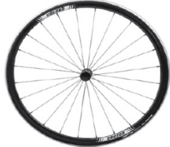
NSW70004 Ruedas Proton