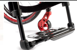
NSW050132 Plataforma única de carbono