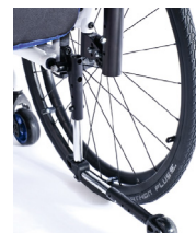
NSW090005 Rueda antivuelco, abatible