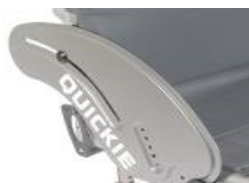
NSW040102 Protector lateral de aluminio (sin fender)