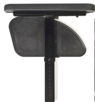
NSW40052 Reposabrazos ajustable en altura mediante herramientas