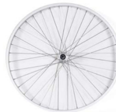
NSW070001 Ruedas c/radios cruzados