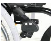
NSW060002 Freno de rodilla