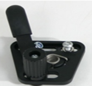
NSW060001 Freno standard