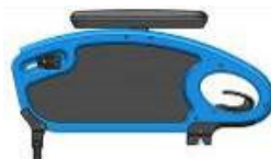
NSW040001 y MSW40003 Reposabrazos de escritorio fijos