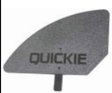
NSW040107 Protector lateral de composite