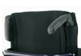
NSW030203 Empuñaduras plegables