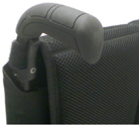
NSW030201 Empuñaduras standard largas