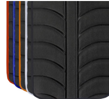
Colores ribetes tapicerías EXO EVO