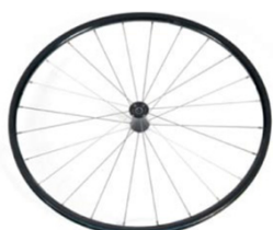
NSW70003 Ruedas ligeras