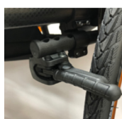
NSW060023 Freno compacto EVO