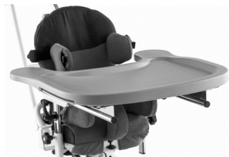
Bandeja plástico (gris)