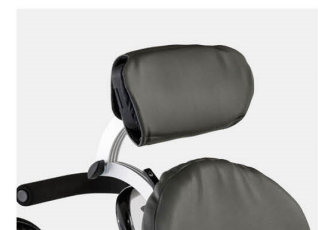
Reposacabezas plano Talla 1 y 2 gris ébano