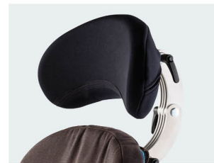
Reposacabezas contorneado tallas 1 y 2