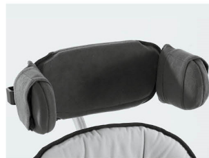
Reposacabezas plano Talla 1 y 2 vinilo gris