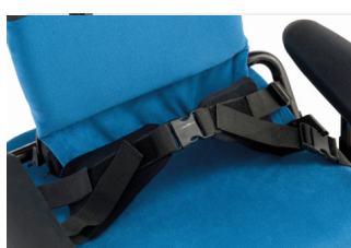
Cinturón pélvico de 4 puntos