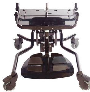
Chasis Hi Low