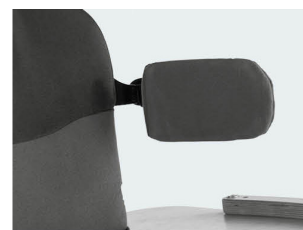
Soportes laterales abatibles PU