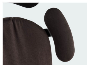
Soportes laterales protractores