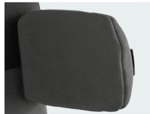
Soportes laterales fijos PU