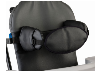
Soporte anterior torácico Tallas 1 y 2