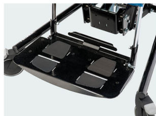
Plataforma metálica Talla 3