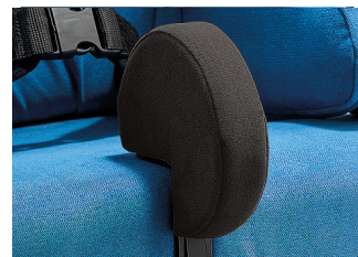
Cuña abductora disco