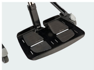
Plataforma metálica Tallas 1 y 2