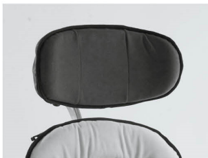
Reposacabezas contorneado Talla 3