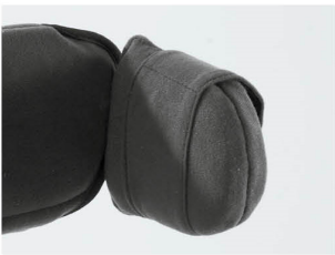
Soportes laterales rep. plano