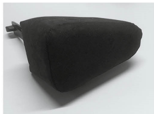
Cuña Abductora Taco