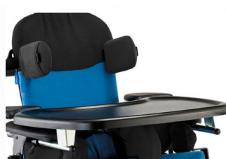
Bandeja plástico (negra)