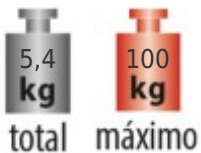
Tabla de medidas y modelos

NOTA: Utilizar solamente en sillas o butacas que tengan al menos un reposabrazos para agarrarse. No se recomienda el uso en sillas de ruedas, automóviles, sillones reclinables o sillas de oficina con ruedas.