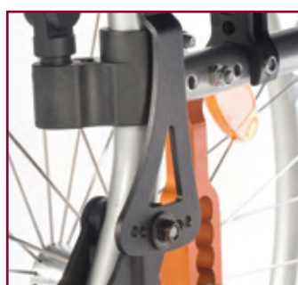
Respaldo ajustable en ángulo (opcional). Ligero y fácil de ajustar. La pletina del eje ofrece un ajuste en ángulo desde -12° a +12° (en incrementos de 4°)