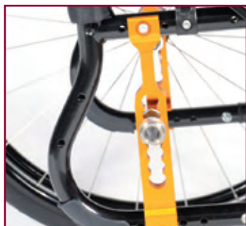
Altura de asiento ajustable en 7 posiciones. Con 4 posiciones del camber (de 0 a 4°) y pletina del eje disponible en 3 colores anodizados (Naranja, Negro y Gris plata)