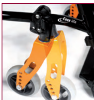
Sencillo ajuste del ángulo de la horquilla Amplio rango de ajuste para garantizar un rendimiento superior en la conducción