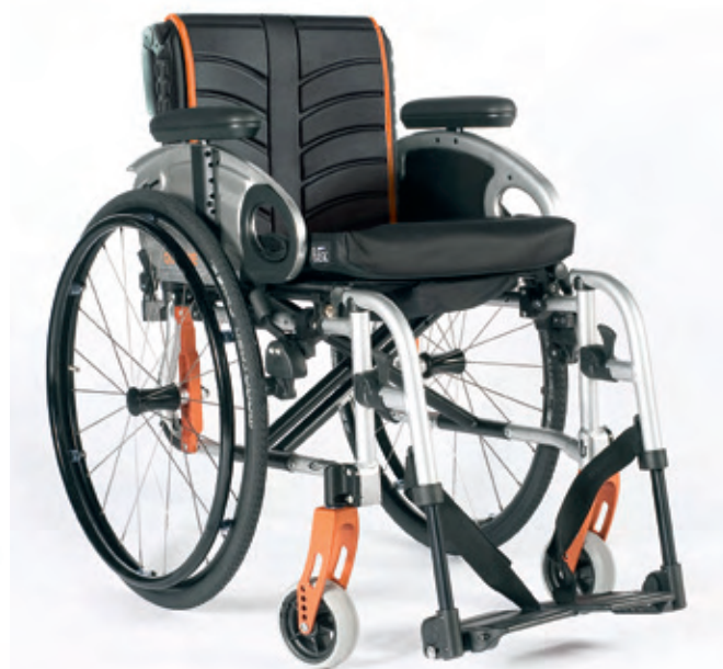
Quickie Life con reposapiés desmontables Disponible con reposapiés a 70° u 80°

Elige tu versión de armazón: con Reposapiés Fijos para una mayor ligereza y un look de silla más activo, o con Reposapiés Desmontables, si deseas una silla más fácil de plegar y transportar. Con múltiples opciones de configuración, para aquellos que no quieren renunciar a nada.