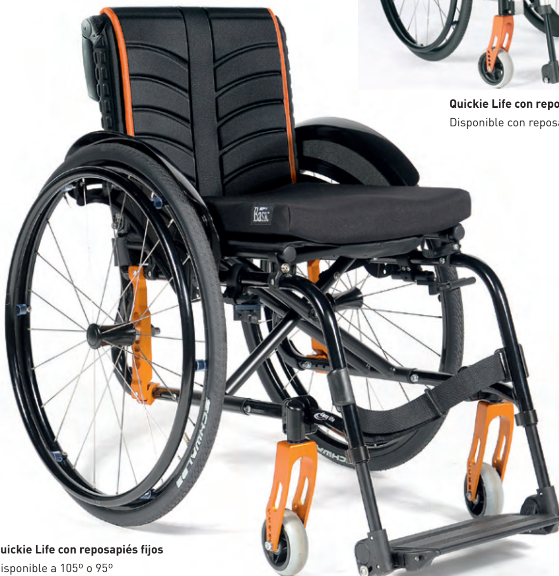
Quickie Life con reposapiés fijos Disponible a 105° o 95°