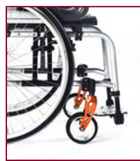
Ángulo de armazón a 95° (opcional). Más corto para mejorar la maniobrabilidad de la silla. Disponible también con curvatura de 2 cm. (sólo con reposapiés fijos).