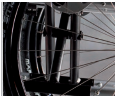
Cruceta de 3 brazos que garantiza una mayor robustez

Quickie Life incorpora además un innovador sistema de autobloqueo del plegado que fija automáticamente la posición de la silla cuando se pliega para facilitar su manejo y apertura. Y con las dimensiones más compactas!!