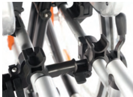
Sistema innovador de autobloqueo del plegado